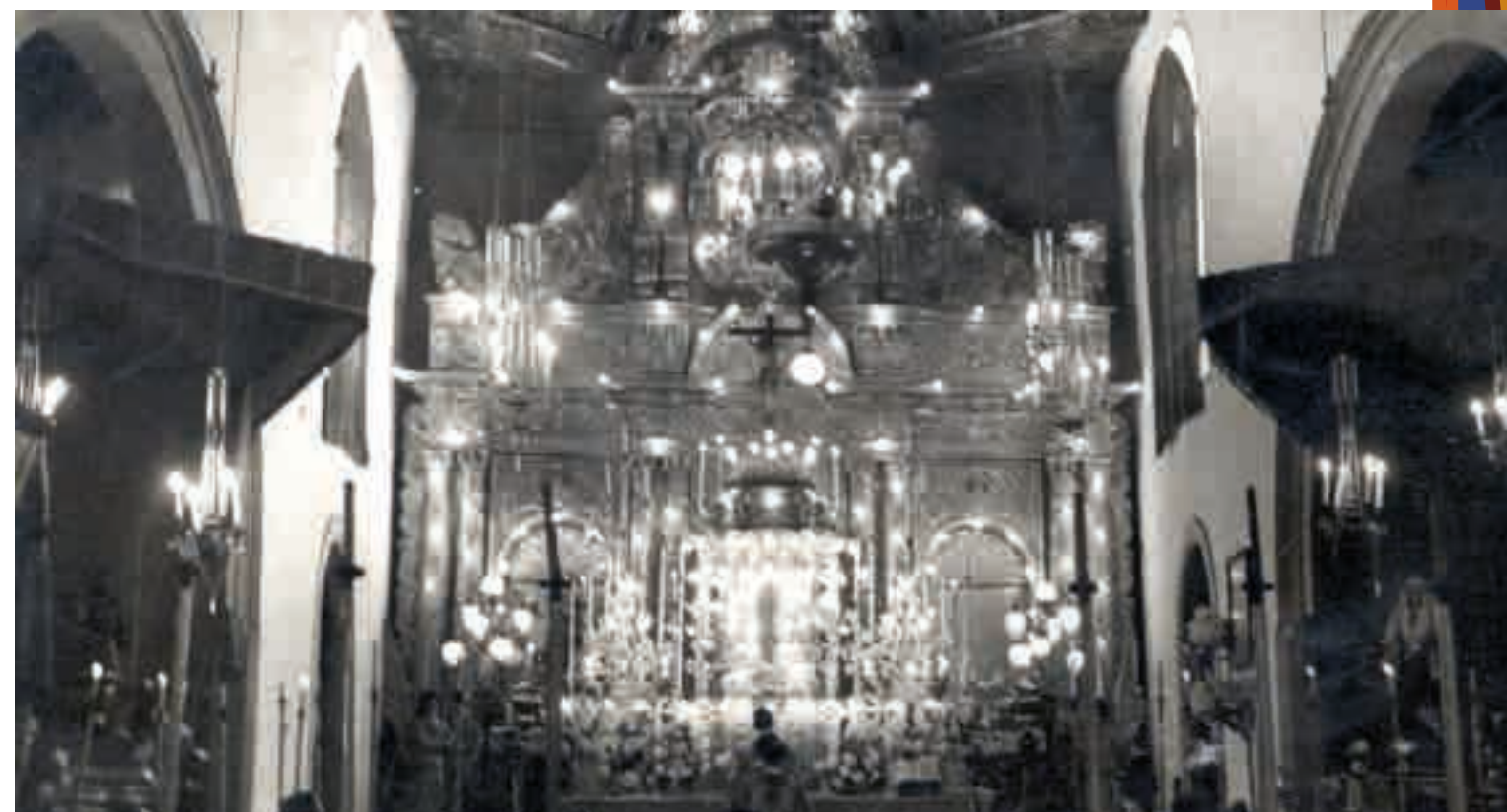
Celebración a San Isidro y Santa María de la Cabeza, años cincuenta del siglo XX.

Terminada la función, la primera autoridad civil y de más jerarquías provinciales se despidieron por tener que marchar al aeródromo de Los Rodeos al objeto de saludar al Excmo. señor Capitán General de Canarias, don Miguel Rodrigo Martínez, con motivo de su viaje a la Península.