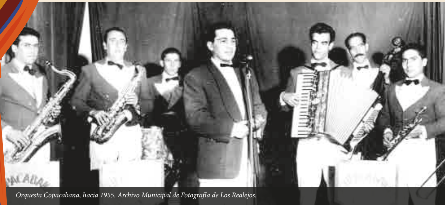
Orquesta Copacabana, hacia 1955.