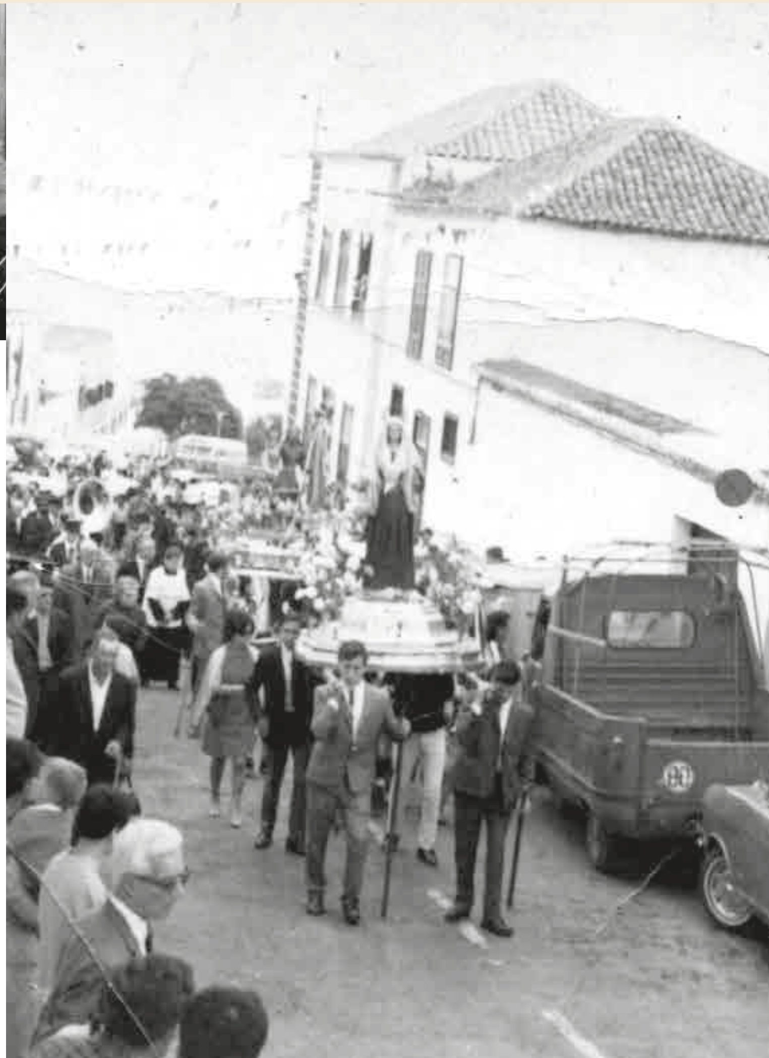
Procesión-romería de San Isidro, hacia 1959.