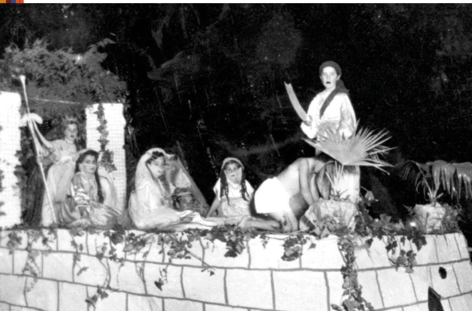
Cabalgata en La Cruz Santa, años cincuenta del siglo XX.

La música y el teatro también fueron protagonistas de los festejos de aquel año. Un concierto musical fue la antesala de un Teatro del Guiñol, celebrado en la plaza de Viera y Clavijo al atardecer del día 15. Siendo el número más esperado la representación de un Auto Sacramental de Calderón de la Barca por parte del Teatro