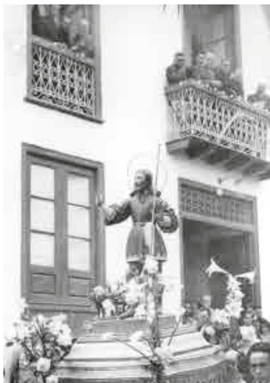
Procesión - romería en honor a San Isidro, años cuarenta del siglo XX. En ella se puede ver la notable presencia de las fuerzas militares.

Español de Divulgación en la citada plaza. El día siguiente, en la tarde tuvo lugar un concurso infantil de «trajes regionales» con premio a la pareja mejor ataviada, todo ello amenizado por la orquesta «Casablanca». Concluían las fiestas con la «Verbena de Primavera» donde a la ya citada orquesta se unía, la también formación realejera «Bolero».