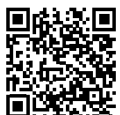
Vídeoclip Canción a Mayo

te decía... ¿tú de dónde eres y de quién eres? Yo no respondía, a ver quién era el valiente.