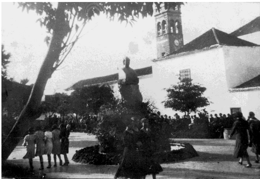
8. Paseos en la Plaza de Viera y Clavijo.