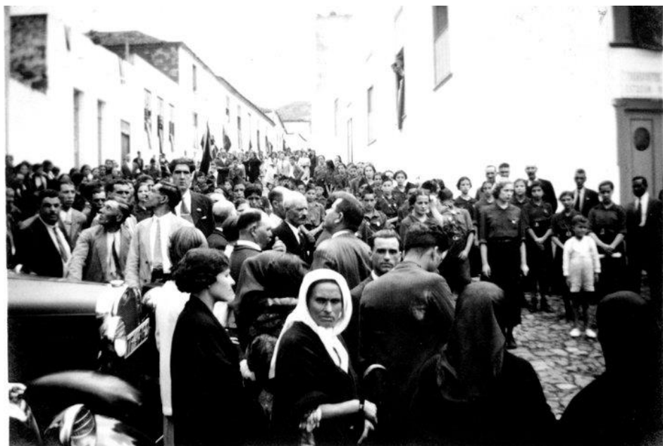
10. Desfile en la Calle de El Medio.