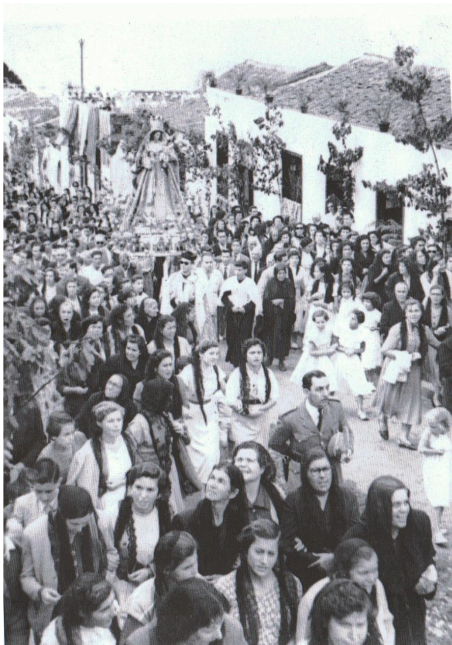
4. Subida a Palo Blanco por la Calle de El Sol, en la peregrinación de 1954.