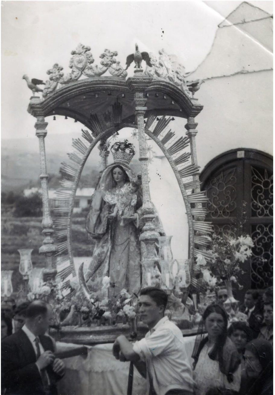
3. Procesión a su paso por la Calle de El Medio.