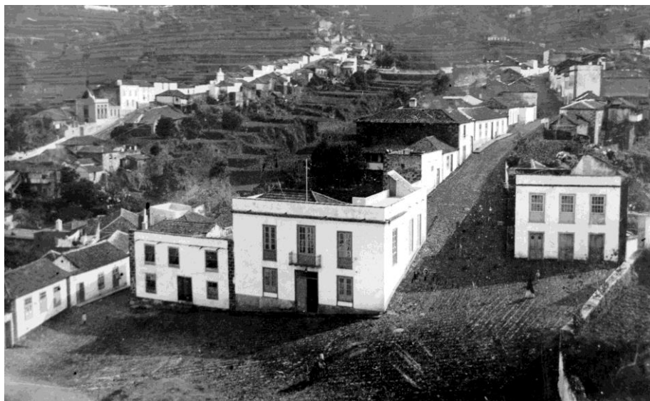
14. Vista de la Plaza, Calle El Medio y Calle El Sol.