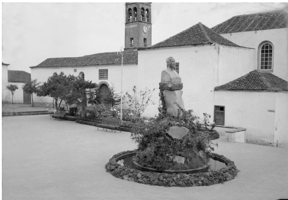
11. Plaza de Viera y Clavijo. ca. 1940