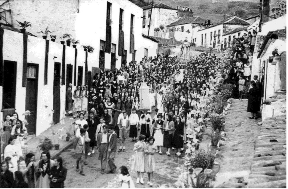
5. Procesión de regreso de Palo Blanco a su paso por la Calle de El Sol.