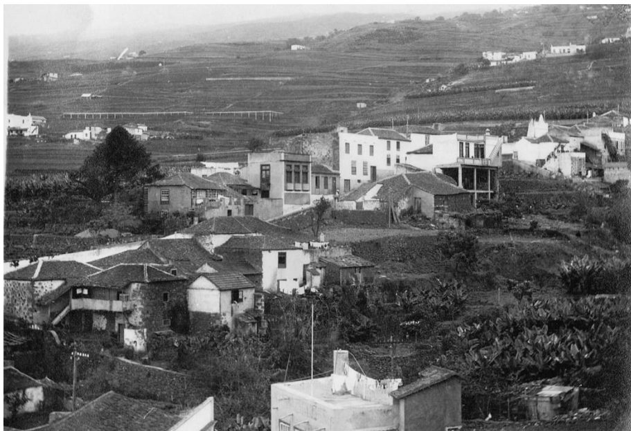
7. Vista del Puente Abajo y la Calle de El Sol.