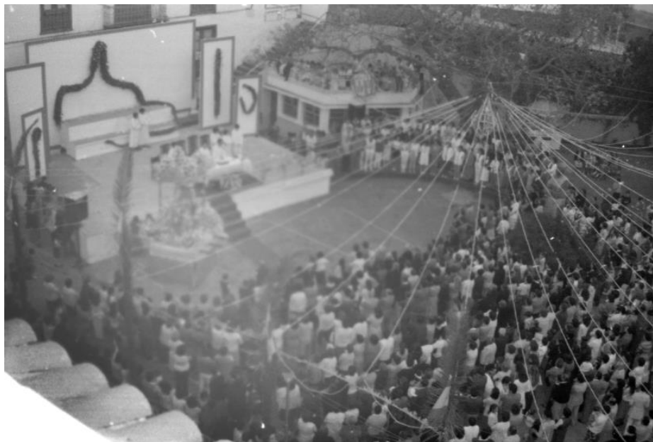
13. Lunes de Remedios durante la restauración de la techumbre del templo, ca. 1983.