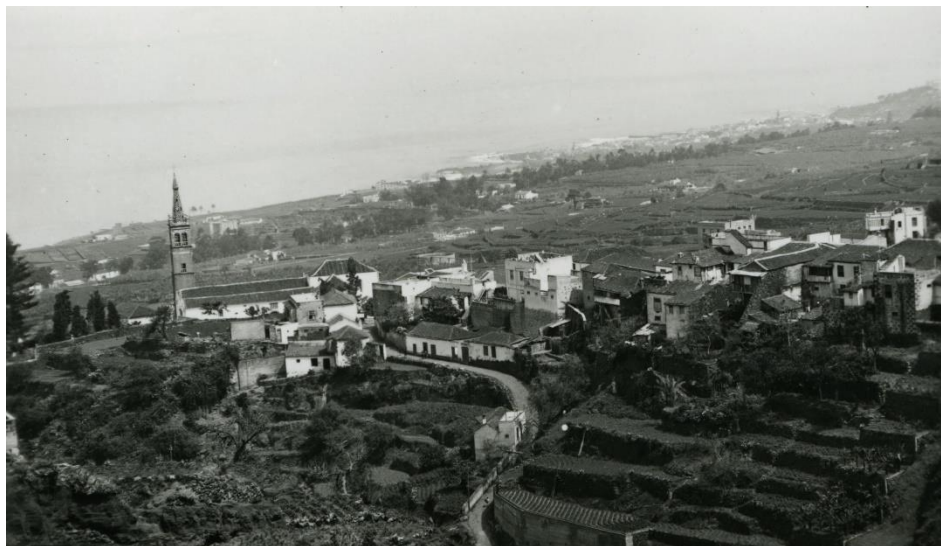
9. Vista del casco y antiguo Cementerio de la plaza.