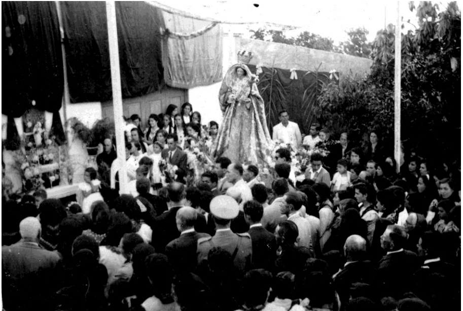
6. Peregrinación de 1954. El Jardín - La Carrera.