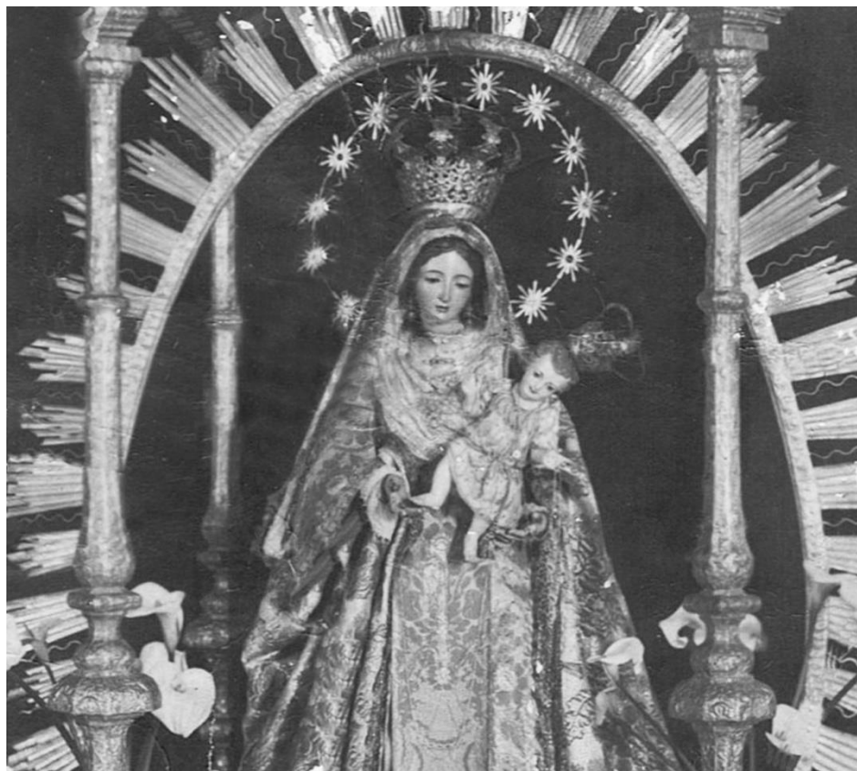
2. Nuestra Señora de Los Remedios. Patrona de Realejo Alto.