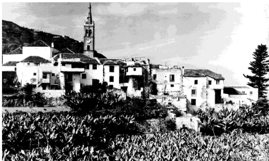
12. Antigua panorámica de Realejo Alto.