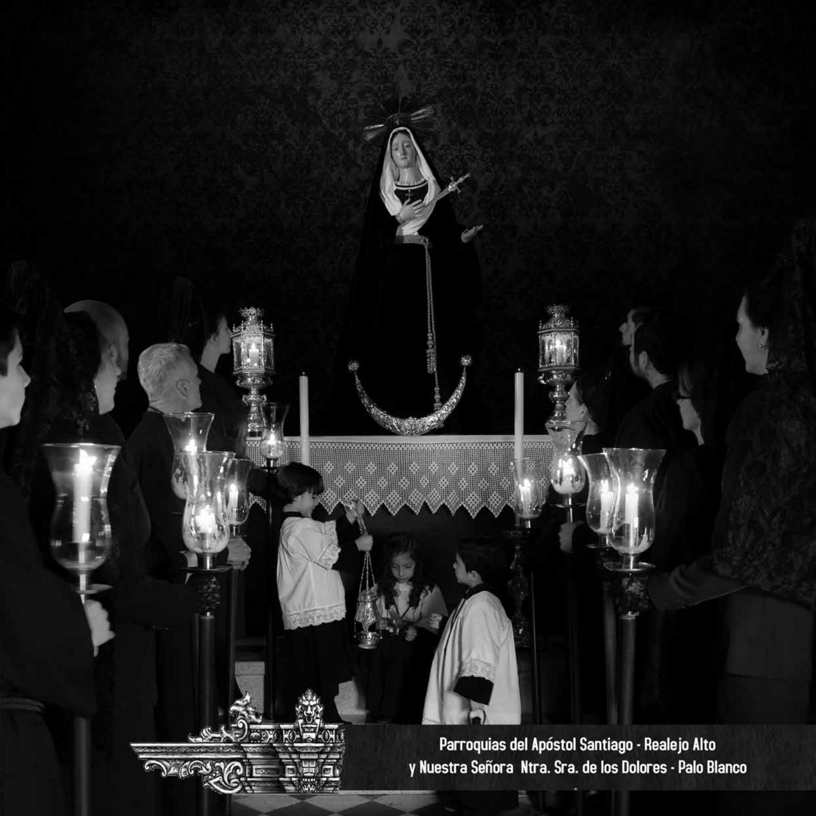
Parroquias del Apóstol Santiago - Realejo Alto y Nuestra Señora Ntra. Sra. de los Dolores - Palo Blanco